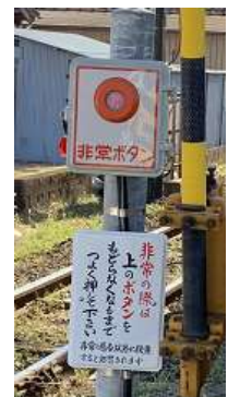
押ボタン式踏切 支障報知装置

④一部の踏切道には、押ボタン式踏切支障報知装置が設置してあります。踏切道内において車が立往生している等、異常があった場合または発見した時は非常ボタンを強く押してください。異常を列車に知らせるシステムになっています。