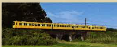
協賛：西美濃・北伊勢観光サミット