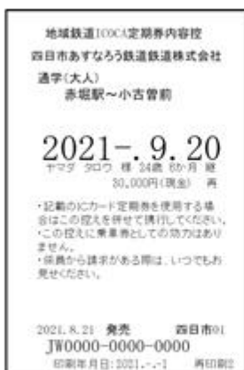
<地域鉄道 IC O C C A 定期券内容控>