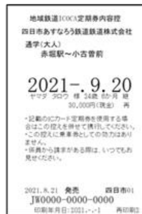
<地域鉄道 IC O C C A 定期券内容控>